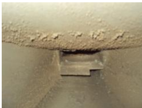
Týden nemytá vagína.