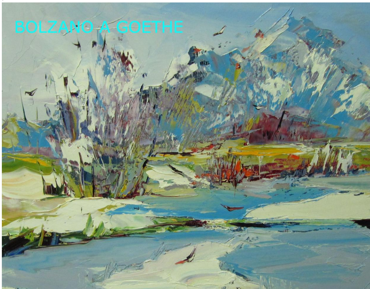
Eckermann Rozhovory s Goethem

Poslední dobou jsem mistrem z Výmaru opravdu posedlý. Má to svoje různé důvody, ale to není právě nejpodstatnější. Každopádně někdy v roce 1824, to už měl mistr 75 let, kdy k němu začal doházet jistý Eckermann, který ve Výmaru zůstal až do Goethovy smrti, který pro něho pracoval a nám zachytil poměrně živě mistra v deníkových záznamech.